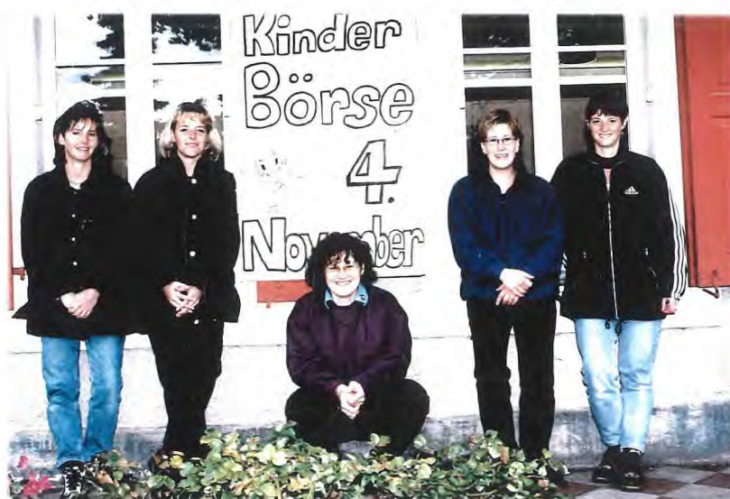
Eröffnung der Kinderkleiderbörse Pippi Langstrumpf im Jahr 2000